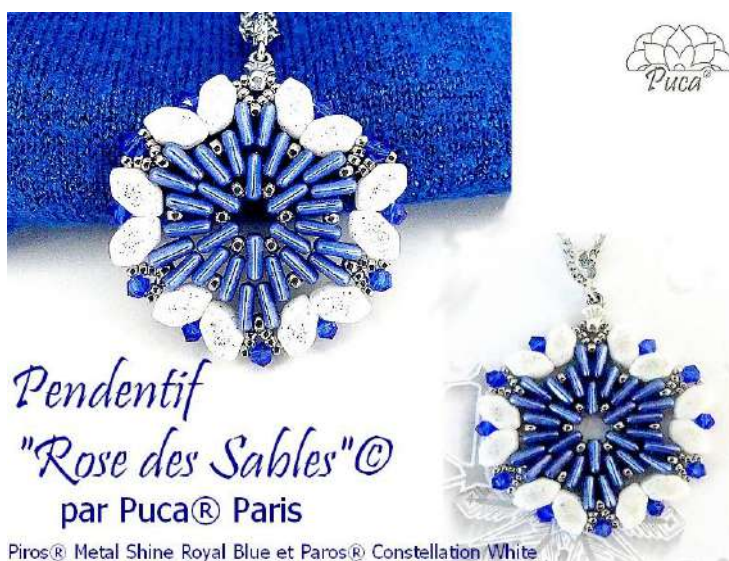
Pendentif "Rose des Sables"© par Puca® Paris

Piros® Metal Shine Royal Blue et Paros® Constellation White