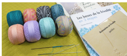
Primi passi con l'ago Chiacchierino

Bienvenuti nel meraviglioso mondo del Chiacchierino ! Nelle prossime pagine troverete le istruzioni per iniziare questo semplice e meraviglioso stile di merletto. (Le immagini possono essere cliccate ed ingrandite per la vostra comodità) Pour commencer, coupez une longueur de fil type fil Lizbeth .