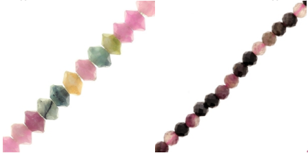
Perline rotonde di tormalina sfaccettata

La leggenda narra che la tormalina abbia attraversato un arcobaleno nel suo viaggio dalle profondità della terra alla superficie, catturando tutti i suoi colori.