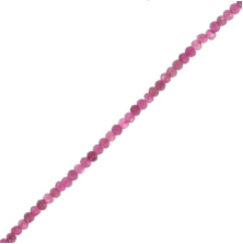
Perline tonde sfaccettate di tormalina