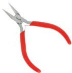
Pinza punte piatte lisce Cod. : OUTIL-467 Quantità : 1