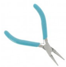
Pince ronde manche pailleté Cod. : OUTIL-134 Quantità : 1