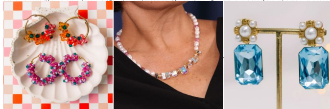
Swarovski: il punto di riferimento per il cristallo di prestigio

I cristalli si presentano in molte forme: trottole, perline rotonde, cabochon, gocce, navette, strass hotfix, pendenti, ecc. Ogni marchio ha le sue specialità, le sue finiture esclusive e la sua gamma di colori.