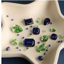
PureCrystal: il cristallo Swarovski a disposizione di tutti

I cristalli Swarovski sono unici in quanto possono essere acquistati solo da professionisti.