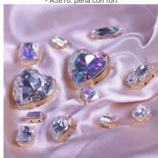
Preciosa: eccellenza ceca

Il marchio ceco Preciosa è un'istituzione nel mondo del cristallo. Fondatao a Jablonec nad Nisou in Boemia, è rinomato per la qualità delle sue perle e la precisione del taglio.