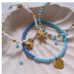
Braccialetti in stile marino con perline rocaille: ideali per mettere in pratica i vostri abbinamenti di blu e bianco.