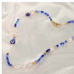
Collana blu e bianca: un classico intramontabile, un gioiello facile da abbinare a un look estivo.

Il nostro consiglio da esperti: se desiderate colori che durino e resistano all'estate, optate per le tonalità Duracoat, che sono più resistenti.