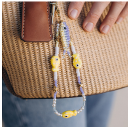
Portachiavi con pendente a forma di pesce realizzato con perline rocaille: un accessorio divertente e veloce da realizzare, perfetto per scoprire la tecnica dell'intreccio con perline rocaille.

Ora che avete tutti i colori a disposizione, è il momento di mettersi all'opera! Ecco una selezione di tutorial per iniziare: