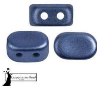
16 Lipsi® par Puca®-Paris