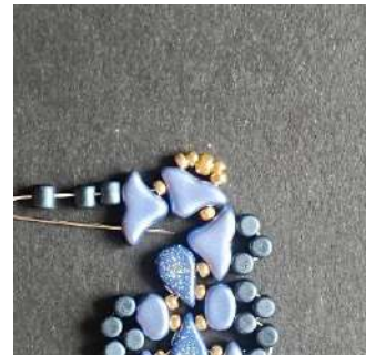
48) Passer dans le 2 nd trou de l'Hélios