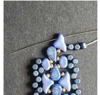
44) Passer dans le 2 nd trou de l' Hélios