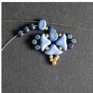
17) Passer dans le 2 nd trou de la Lipsi