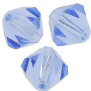
9 Toupies 3 mm (T3)