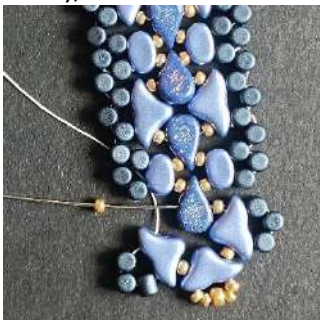
49) Répéter les étapes 33 à 39