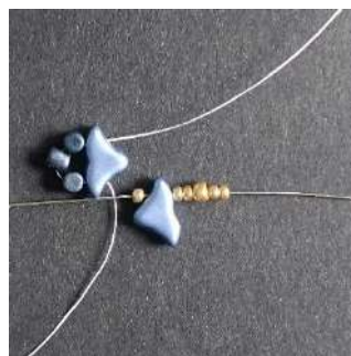
3) Placer 1 R11, 1 Hélios, 2 R11, 1 R8 (ou 1 Pilos), 2 Hélios