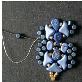
35) Placer 1 Minos dans la Minos précédente et passer dans la Lipsi la R11