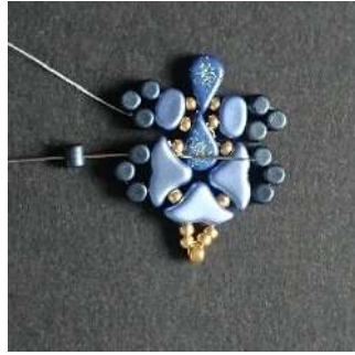
22) Placer 1 Minos dans la la Minos précédente et passer dans l'Hélios