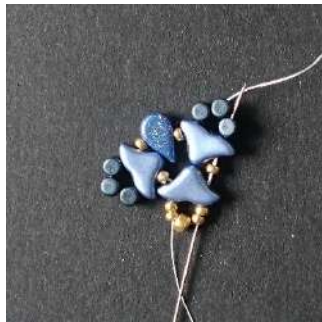
11) Passer dans les 2 R11, l' Hélios, la R11, la Minos