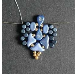
27) Passer dans la Minos, la Lipsi, la R11, l'Amos