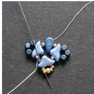
10) Passer dans l' Hélios, les 2 R11 comme ceci