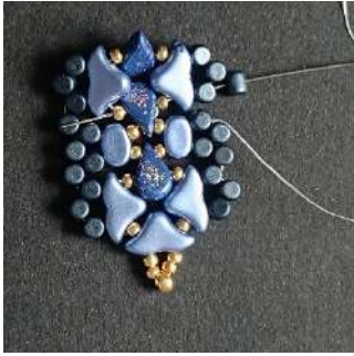
37) Placer 1 Minos dans la Minos précédente et passer dans l' Hélios, la R11, l' Amos, la R11