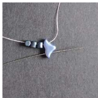
2) Passer dans le 2 nd trou de l'Hélios