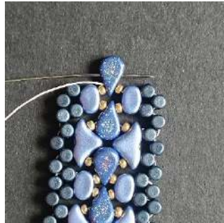
42) Répéter l'étape 16 à 28, comme ceci