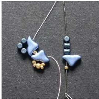
5) Placer 1 R11, 1 Hélios, 3 Minos