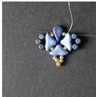
14) Faites un double nœud, couper l'extrémité du fil. Passer dans la R11, la Amos