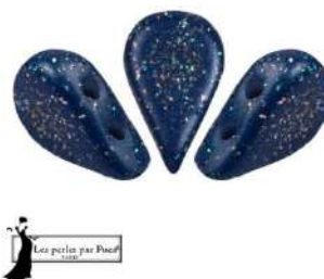
16 Amos® par Puca®-Paris