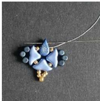
15) Passer dans l'Amos (trou côté pointe)