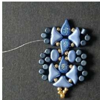
34) Vous obtenez ceci