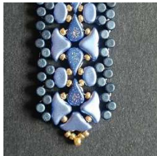
50) Répéter les étapes 9 à 14