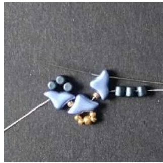
6) Passer dans le 2 nd trou de l'Hélios