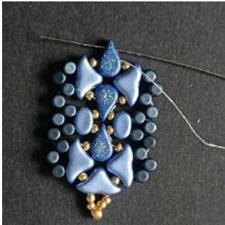
41) Passer dans l' Amos (trou côté pointe) et répéter les étape 16 à 41), 6 fois