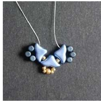
7) Vous obtenez ceci