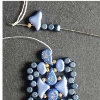
43) Placer 1 R11, 1 Hélios, 3 Minos