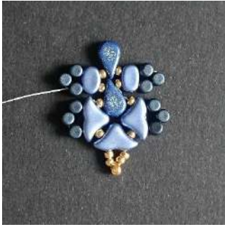
21) Vous obtenez ceci