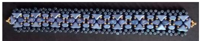
51) Voici le résultat