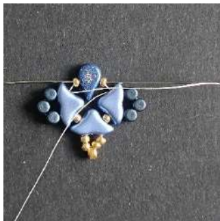
13) Passer dans la R11, l'Amos la R11