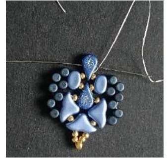
28) Passer dans le 2 nd trou de l'Amos (trou côté rond)