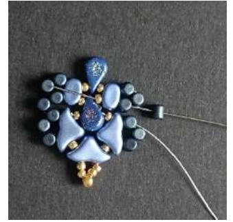
24) Placer 1 Minos dans la la Minos et passer dans la Lipsi, la R11