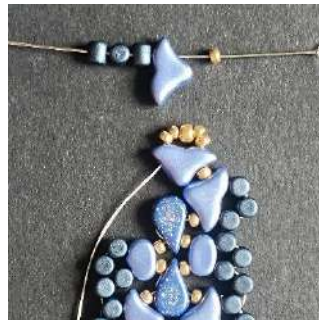
47) Placer 1 R11, 1 Hélios, 3 Minos