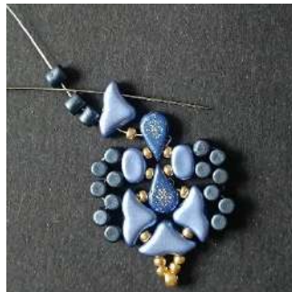
30) Passer dans le 2 nd trou de l'Hélios