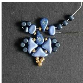
19) Passer dans le 2 nd trou de la Lipsi