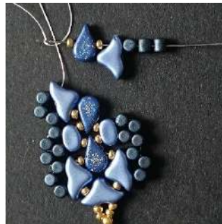
31) Placer 1 R11, 1 Amos (trou côté rond), 1 R11, 1 Hélios, 3 Minos