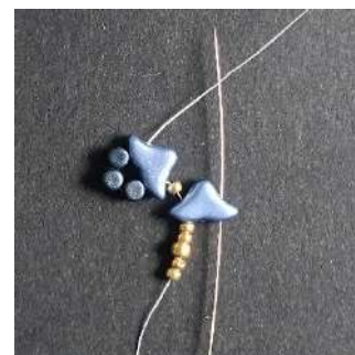
4) Passer dans le 2 nd trou de l'Hélios