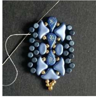
39) Passer dans les 2 Minos suivante