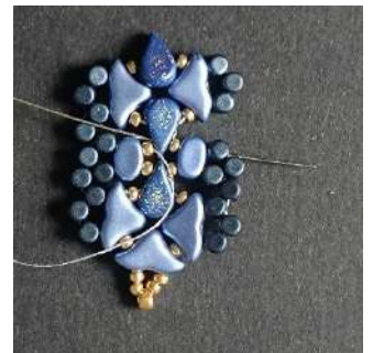
36) Passer dans la Amos (trou côté pointe), la R11, la Lipsi, la Minos