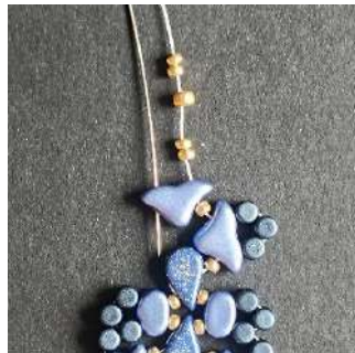
46) Passer dans le 2 nd trou de l'Hélios