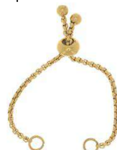
1 Fermoir au choix