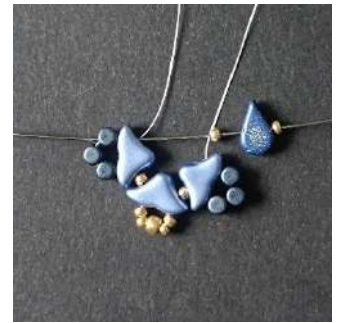
8) Placer 1 R11, 1 Amos (trou côté rond), 1 R11 dans l'Hélios, la Minos comme ceci