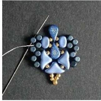
26) Passer dans la Minos suivante