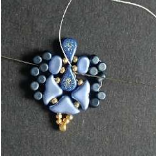
25) Passer dans l'Amos, la r11, la Lipsi, la Minos