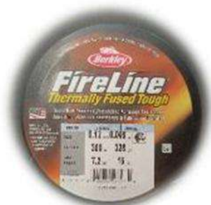
Fil Fireline 0.12