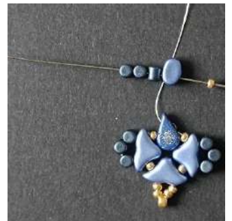
16) Placer 1 R11, 1 Lipsi, 3 Minos