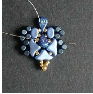
23) Passer dans la R11, l'Amos, la R11, l'Hélios, la Minos