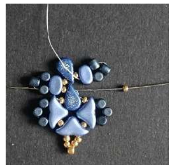
20) Placer 1 R11 dans l'Amos précédente (trou côté pointe), et passer dans la R11, la Lipsi, la Minos