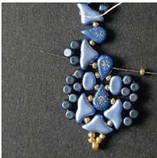
33) Placer 1 R11 dans l'Amos et passer dans la R11, l'Hélios, la Minos