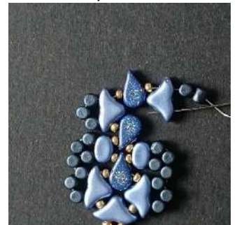
32) Passer dans le 2 nd trou de l'Hélios