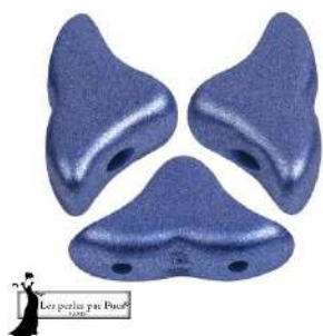
20 Hélios® par Puca®-Paris