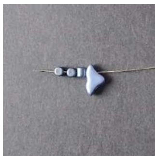
1) Placer 1 Hélios, 3 Minos, comme ceci