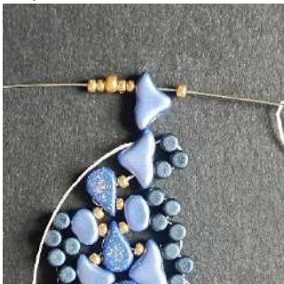
45) Placer 1 R11, 1 Hélios, 2 R11, 1 R8 (ou 1 Pilos), 2 R11