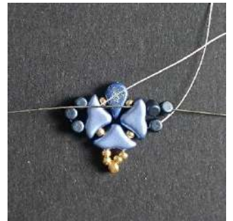
12) Passer dans les 2 Minos, l'Hélios