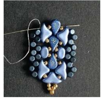
40) Passer dans la R11, l' Amos