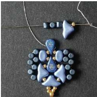
29) Placer 1 R11, 1 Hélios, 3 Minos