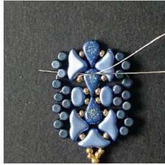
38) Passer dans l' Hélios, la Minos