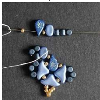
18) Placer 1 R11, 1 Amos (trou côté pointe), 1 R11, 1 Lipsi, 3 Minos