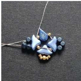
9) Passer dans les 2 Minos, l' Hélios, la R11