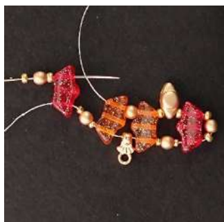
6) Posizionare 1 R15, 1 P3, 1 R15, 1 Délos, 1 R11, 1 P3, 1 R11 e far passare nel 1° foro della Délos