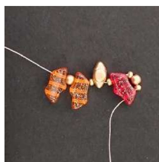
3) In questo modo