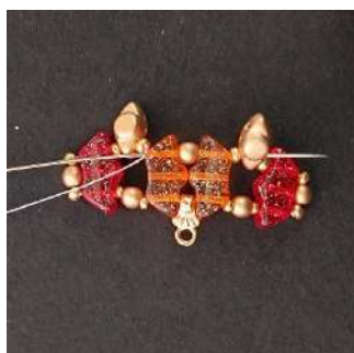
9) Passare attraverso tutte le perline