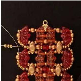
57) Posizionare 3 R11 nelle 2 R11 e passare attraverso tutte le perline e le 2 R11