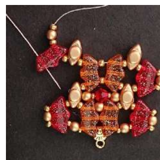
20) Passare nel 1° foro della Délos