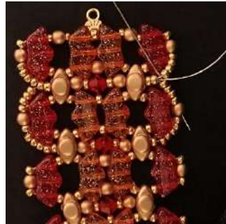
58) Passare attraverso le 4 R11, la P3, in questo modo