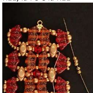
50) Posizionare 5 R11 nella R11, nella P3 e nella R11