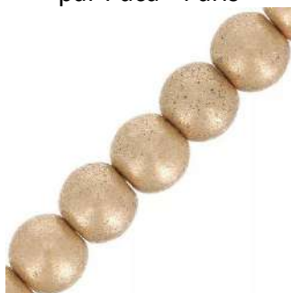
66 Perline rotonde 3 mm (T3)