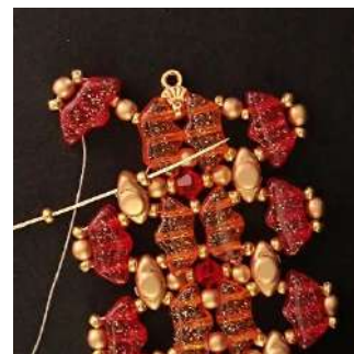
44) Posizionare 1 R11 nella Volos, la R11