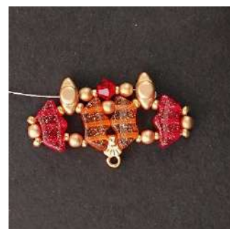
12) In questo modo