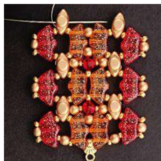
38) Ripetere i passaggi da 10 a 36, per 3 volte