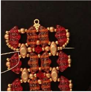
53) Passare attraverso tutte le perline, posizionarsi nei 2 R11