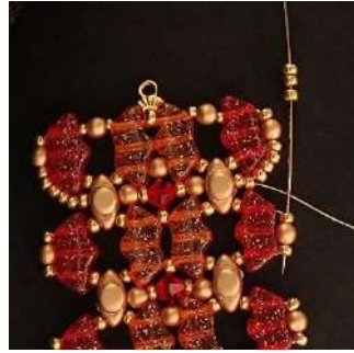
54) Posizionare 3 R11 nell'R11, nel P3, nell'R11