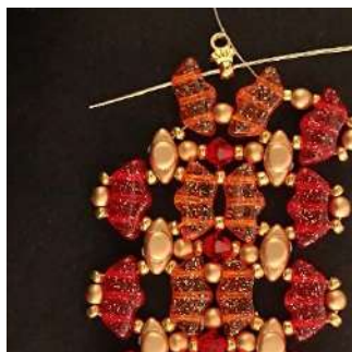
41) Posizionare 1 Pilos nella Délos successiva