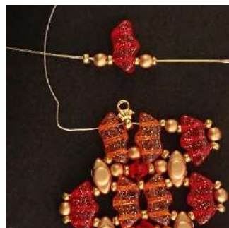
42) Posizionare 1 R15, 1 P3, 1 R15, 1 Délos, 1 R11, 1 P3, 1 R11