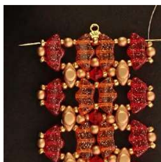
47) Passare attraverso tutte le perline