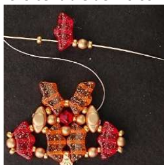
15) Posizionare 1 R11, 1 Délos, 1 R11, 1 P3, 1 R11