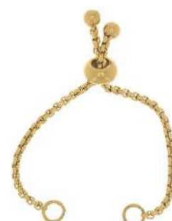
1 chiusura a scelta