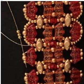
61) Posizionare 3 R11 nell'R11, nella P3 e nell'R1