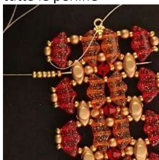
49) Posizionare 5 R11 nel foro centrale della Volos e passare attraverso tutte le perline