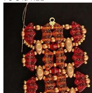
52) Passare attraverso la R11, la P3 e la R11