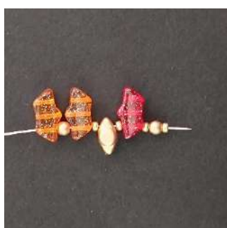
1) Posizionare 1 Délos, 1 P3, 1 R11, 1 Volos, 1 R11, 1 Délos, 1 R11, 1 P3, 1 R11

Attenzione a posizionare correttamente i Délos e i Volos come nelle foto.