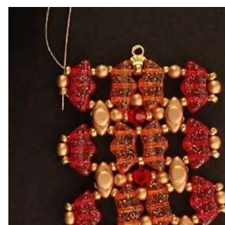
48) Passare attraverso la P3 e la R11