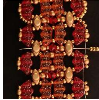
55) Posizionare 5 R11 nel foro centrale del Volos e passare attraverso tutte le perline