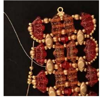
56) Posizionare 5 R11 nell'R11, nel P3, nell'R11