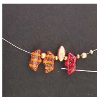
2) Far passare attraverso il 3° foro del Délos