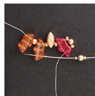
4) Posizionare 1 R15, 1 P3, 1 R15 nel 3° foro della Délos