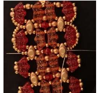
60) Passare attraverso tutte le perline e le 2 R11