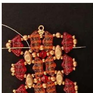
45) Passare attraverso tutte le perline