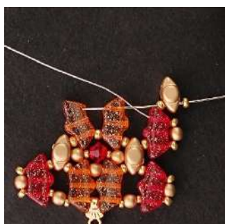
17) Posizionare 1 R11, 1 Volos, 1 R11 nel 3° foro della Délos