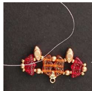
8) Fare un doppio nodo, tagliare l'estremità del filo