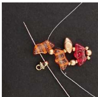
5) Posizionare 1 Pilos nel 3° foro della successiva Délos