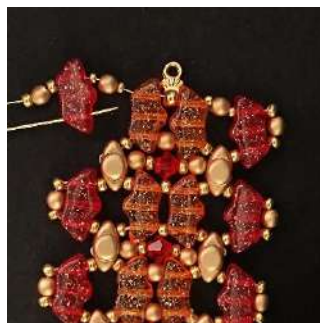
43) Passare nel 1° foro della Délos