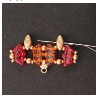
10) Passare attraverso il foro centrale del Volos