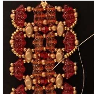
59) Passare attraverso le 6 R11