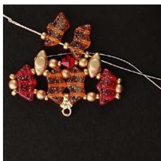
14) Posizionare 1 R11, 1 Délos, 1 R11, 1 Délos, 1 R11 nel 3° foro della Volos