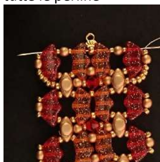
51) Passare attraverso tutte le perline