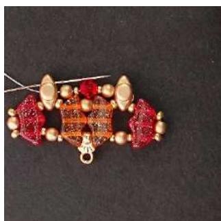
13) Passare nel foro centrale della Volos