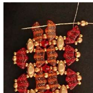
40) Posizionare 1 R15, 1 P3, 1 R15 nel 3° foro del Délos