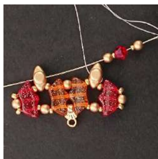
11) Posizionare 1 P3, 1 R15, 1 T4, 1 R15, 1 P3 nel foro centrale del Volos