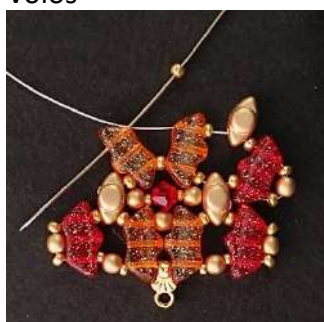
18) Posizionare 1 R11 nel 3° foro della successiva Délos