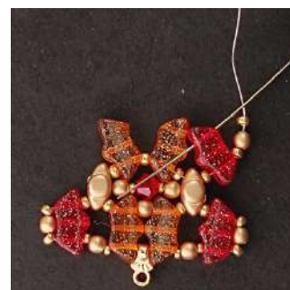
16) Passare nel 3° foro della Délos