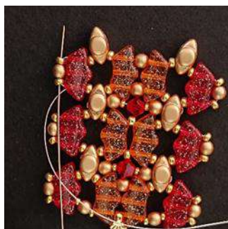
37) Passare attraverso l'R11, il P3, l'R11