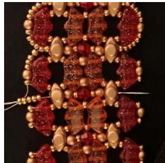
62) Posizionare 5 R11 nel foro centrale della Volos e passare attraverso tutte le perline