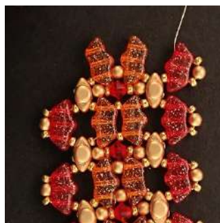
39) Ripetere i passaggi da 11 a 30, in questo modo