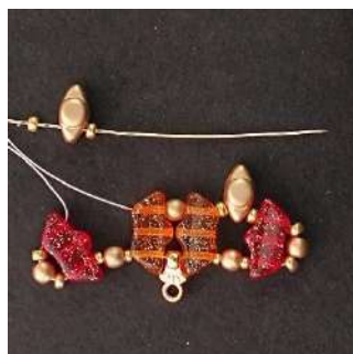
7) Posizionare 1 R11, 1 Pilos, 1 Volos, 1 R11