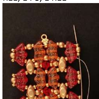
46) Passare attraverso la R11, la P3 e la R11