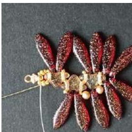
21) Passare nella Pilos, nelle Rocailles