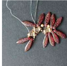
14) Passare nel Daggers, nella R15, nell'Helios, nella R15, nell'Helios, nella R15