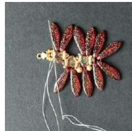
19) Passare nell'Helios