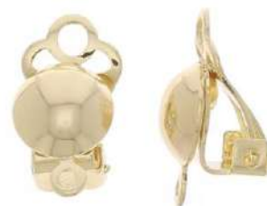
2 Clip per orecchini