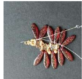
20) Passare nei Rocailles