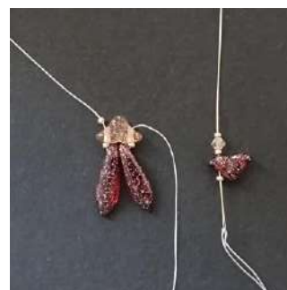
4) Posizionare 1 R15, 1 Hélios, 1 R15, 1 T3, 1 R15