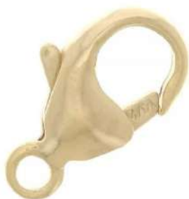
1 Chiusura a moschettone