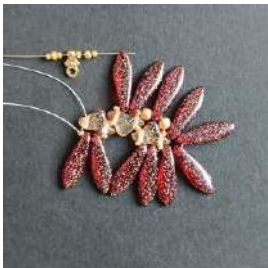
17) Posizionare 1 R15, 1 R11, 1 R15, 1 Pilos, 1 R15, 1 R11, 1 R15