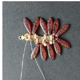
18) Fare un doppio nodo con il filo rimanente