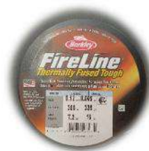
Filo Fireline 0.12