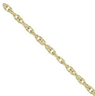
1 Catena da 40 cm