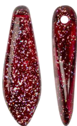
55 Daggers FP Selection®