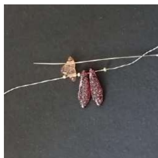
2) Passare nel 2° foro dell'Hélios