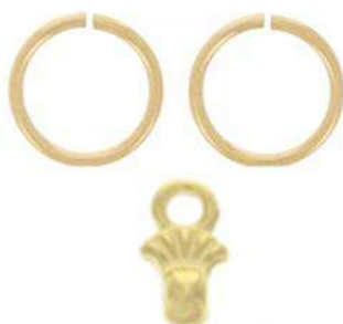
6 Anelli da 4 mm 4 Cymbal Pilos