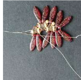
15) Passare nei 2 Daggers, nella R15