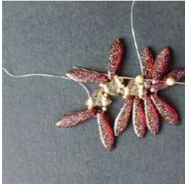
13) Posizionare 1 P3, 1 R15, 1 P3 nella R15 e il Daggers