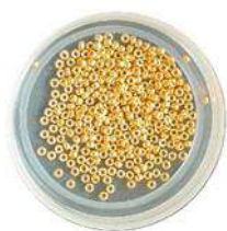
Rocailles 15/0 (R15) Rocailles 11/0 (R11)