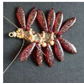
23) Passare nella R15, nella Dagger successiva