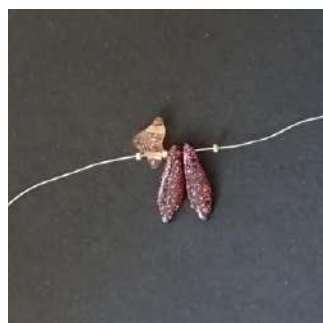
1) Posizionare 1 R15, 1 Hélios (in questo senso), 1 R15, 2 Daggers, 1 R15