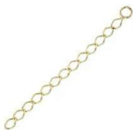
1 Catenella di prolunga