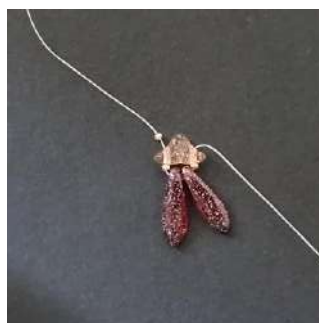
3) Si ottiene questo