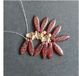
16) Passare nell'Helios