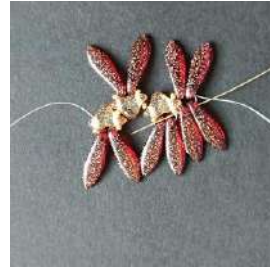
11) In questo modo