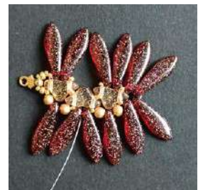
24) Si ottiene questo