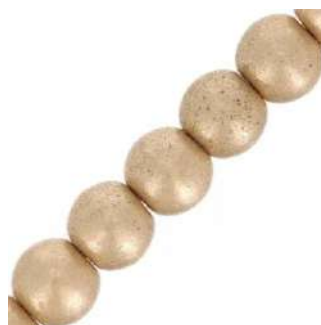
41 perline rotonde da 3 mm (P3)