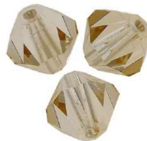
9 Biconi 3 mm (T3)