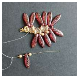
22) Posizionare 1 P3, 1 Dagger, 1 P3