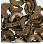
Arcos® di Puca® 5x10 mm Dark Gold Bronze x10g Cod. : TCHE-183 Quantità : 2