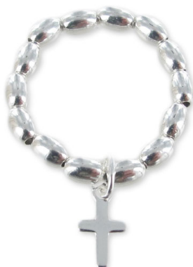
Silver Ring 925

Fase 1: Tagliare circa 30 cm di filo elastico. Raddoppia il filo e messo su circa 14 olive 925 (il numero di perline varia a seconda del ring) e il fascino trasversale. Fase 2: Fare 2 o 3 nodi di Cappuccini. Per ulteriori spiegazioni per rendersi conto che il nodo, clicca qui: Nodo del Cappuccini Trascinare i nodi in un perle ovali. Gold Filled strass Anello