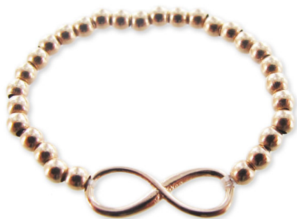
Infinity oro rosa anello Riempito

Fase 1: Tagliare circa 30 cm di filo elastico. Far passare il filo attraverso uno dei fori di sfioro, raddoppierà il filo. Mettere questo raddoppiato filato, rotonda circa 28 mm 2 (il numero di perline varia a seconda del ring). Passare filato sempre raddoppiato nell'altro foro di infinito. Fase 2: Fare 2 o 3 nodi di Cappuccini. Per ulteriori spiegazioni per rendersi conto che il nodo, clicca qui: Nodo del Cappuccini Trascinare i nodi in una delle perle.