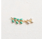
Step 6: Unite il pezzo di catena al pezzo di catena con l'anello.