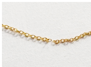
Step 2: Con l'aiuto di un anello aperto unire il pendente alla catena.