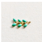
Step 4: Prendete due maglie della catena e appiccicatele la catena.