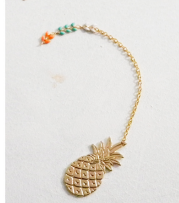
Ripetete le tappe fino ad ottenere una collana di circa 50-55 cm.