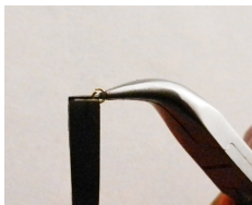
Step 1: Aprire una delle maglie della catena.