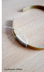
Les fantaisies d'Elona

Fase 1: Prendere il bracciale in ottone e iniziare a costruire uno dei ricami figlio da parte del filo d'argento.