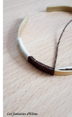
Les fantaisies d'Elona

Fase 2: Prendere un altro filato broderie in un altro colore, qui il rame, e continua tessere sul primo filo.