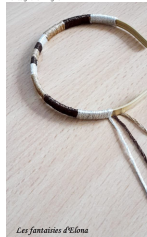
Les fantaisies d'Elona

Fase 5: Dopo la tessitura, mettere un punto di colla sul retro del bracciale e lasciare asciugare. Per tagliare il figlio.