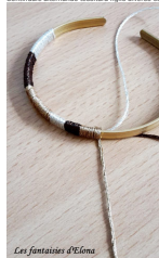
Les fantaisies d'Elona

Fase 4: Continuare alternando tessitura figlio diverso come si desidera.