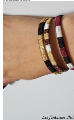
Les fantaisies d'Elona