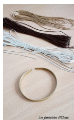
Les fantaisies d'Elona

Fase 1: Prendere il bracciale in ottone e iniziare a costruire uno dei ricami figlio da parte del filo d'argento.