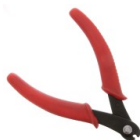
Pinza tagliafili molla armonica Eco Cod. : OUTIL-471 Quantità : 1