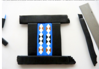
Image 5: The fourth step of the project, showing the assembly of the beads and string.

Image 4: The third step of the project, showing the assembly of the beads and string.