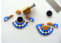
Image 3: The second step of the project, showing the assembly of the beads and string.

Image 2: The first step of the project, showing the initial assembly of the beads and string.