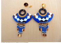
Image 11: The tenth step of the project, showing the assembly of the beads and string.

Image 10: The ninth step of the project, showing the assembly of the beads and string.