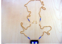
Image 10: The ninth step of the project, showing the assembly of the beads and string.

Image 9: The eighth step of the project, showing the assembly of the beads and string.