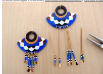
Image 8: The seventh step of the project, showing the assembly of the beads and string.

Image 7: The sixth step of the project, showing the assembly of the beads and string.