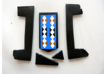
Image 6: The fifth step of the project, showing the assembly of the beads and string.

Image 5: The fourth step of the project, showing the assembly of the beads and string.