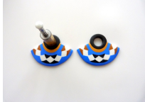
Image 4: The third step of the project, showing the assembly of the beads and string.

Image 3: The second step of the project, showing the assembly of the beads and string.