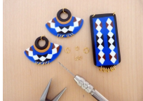
Image 7: The sixth step of the project, showing the assembly of the beads and string.

Image 6: The fifth step of the project, showing the assembly of the beads and string.