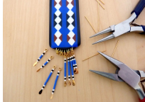
Image 9: The eighth step of the project, showing the assembly of the beads and string.

Image 8: The seventh step of the project, showing the assembly of the beads and string.