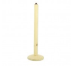
Pied de lampe en bois brut pour la création d'abat-jour 31 cm Tige x1 Cod. : TOOL-646 Quantità : 1