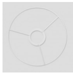
Cerchio per paralume 20 cm Bianco x1 Cod. : TOOL-618 Quantità : 1