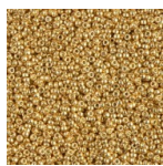
Rocaille Miyuki Duracoat 15/0 4202 - Galvanized Gold x8g Cod. : MR15/4202 Quantità : 1