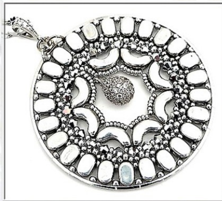
Lipsi® et Arcos® Argentées Silver