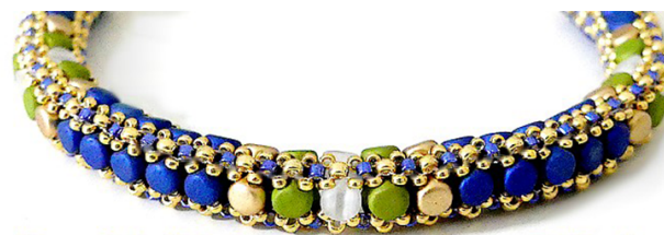
Bracelet "Michelle"© par Puca®-Paris

Kalos® Trendy Sienna Mat, Light Olive Mat, Mustard Mat et Light Gold mat