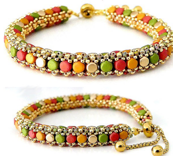
Bracelet "Michelle"© par Puca®-Paris

Kalos® Trendy Sienna Mat, Light Olive Mat, Mustard Mat et Light Gold mat