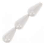
Pere madreperlate mm. 16x9 White x10 Cod. : PEARL-151 Quantità : 1