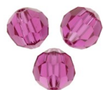
Preciosa Crystal Faceted Rounds 6 mm - Fuchsia x6 Cod. : PCC-606 Quantità : 1