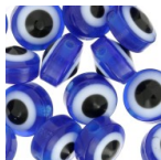
Perline rotonde piatte - occhio portafortuna - 8x5.5 mm - Blu x20 Cod. : STQ-342 Quantità : 1