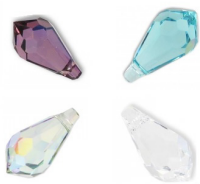
Passaggio 1 Infilare il cordone di vetro sul filo di nylon

Come realizzare una collana con una goccia PureCrystal? Ideale per i principianti, ecco un semplice e veloce tutorial sulla collana. Avrai bisogno di una goccia di PureCrystal 6000 , filo di nylon e una fibbia a molle e quindici minuti più tardi, otterrai una bella collana discreta che potrai declinare in vari colori. Trova tutti i nostri semplici tutorial , perfetti per creare il tuo gioiello o fare un regalo ai tuoi amici.