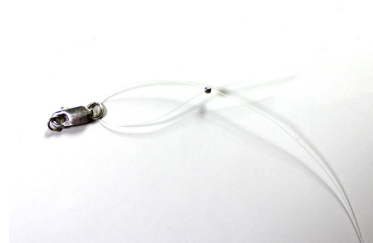
Passaggio 3 Pizzicare la perline a crimpare con un paio di pinze o con un paio di forbici