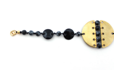
Il tuo bracciale in Perles & Co piace vedere quello che a raggiungere attraverso le estremità offerte su Perles & Co. così, non vedete a tirare il filo della tua creazione nel nuovo cavo e distribuire nel tuo bracciale e distribuire nel tuo bracciale .