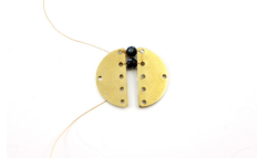
Figura 5: Continuare ad attaccare altre perle nello stesso modo pensando che il filo è visibile da un'altra che un lato dei dischi. Un lato dovrebbe apparire come la foto, perché nella collana, dipinge tutto con il filo più in alto a passare il filo nella ultima perla prima del taglio. Mettere un po' di colla sui nodi per essere sicuri che non cadano a pezzi.