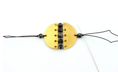
Figura 8: Infilare l'ago metallico e tirare a fare un nuovo nodo alla base di questo punto. Continuare questo con un nuovo conduttore perla, un dischetto e tre perle. Infilare una perla grande e una piccola perla 5 mm, passare il filo nella compressa e collassare il tallone con una speciale pinza tallone colla. Mettere un po' di colla sul tallone e filo e posto sopra una gomma nascosta per colla. Tagliare il filo rimanente. Aggiungere un microtubo con anelli aperti. Aggiungerli attraverso come molti anelli che serve per regolare la lunghezza per le dimensioni del polso e aggiungere una colla di estensione.