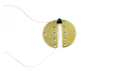
Figura 3: Fare un altro filo e un altro tallone nella parte nel filo accanto e passare nel filo accanto sotto quest'altro.