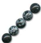
Perline Ossidiana maculata mm. 4 x20 Cod. : SP-033 Quantità : 1