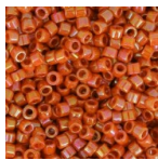
Miyuki Delica 11/0 DB2274 - Opaque Glazed Persimmon x8g Cod. : DB-2274 Quantità : 1