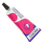
Colla per gioielli Hasulith ml. 30 Cod. : OUTIL-007 Quantità : 1